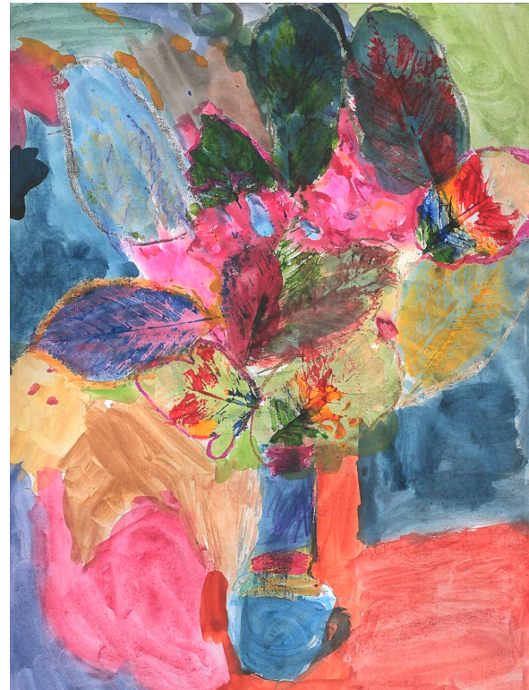
Tegninger fra Åsskrevet 2023

Og netop muligheden for at være et fristed for frie mennesker til sammen at finde ud af tingene er jo på mange måder afsættet for de frie grundskoler; et sted hvor vi kan sætte