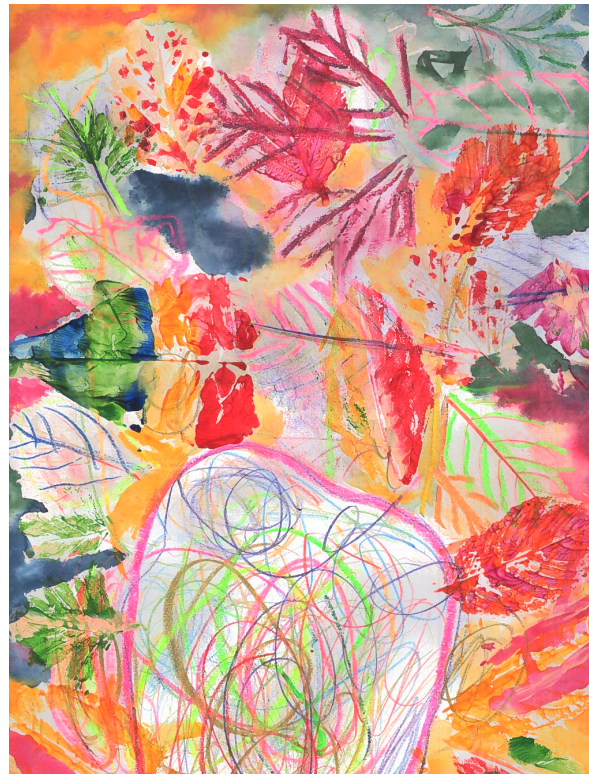
Tegninger fra Årskiftet 2023

Spørgsmålet som imidlertid skal besvares, uanset samarbejdet med PPR, er hvordan man, indenfor de pædagogiske rammer man har sat og sætter for skolen, kan løfte de børn og unge der går der. Er det stigende antal af børn med diagnoser og særlige udfordringer potentielt en 'trussel' mod lilleskolernes pædagogiske praksisser og måder at indrette sig på? Hvad sker der med balancerne mellem hensyntagen til